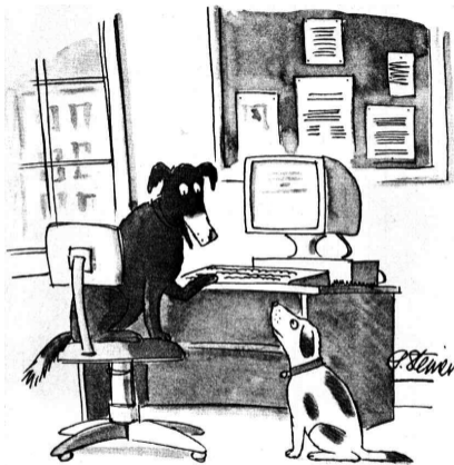
"On the Internet, nobody knows you're a dog."